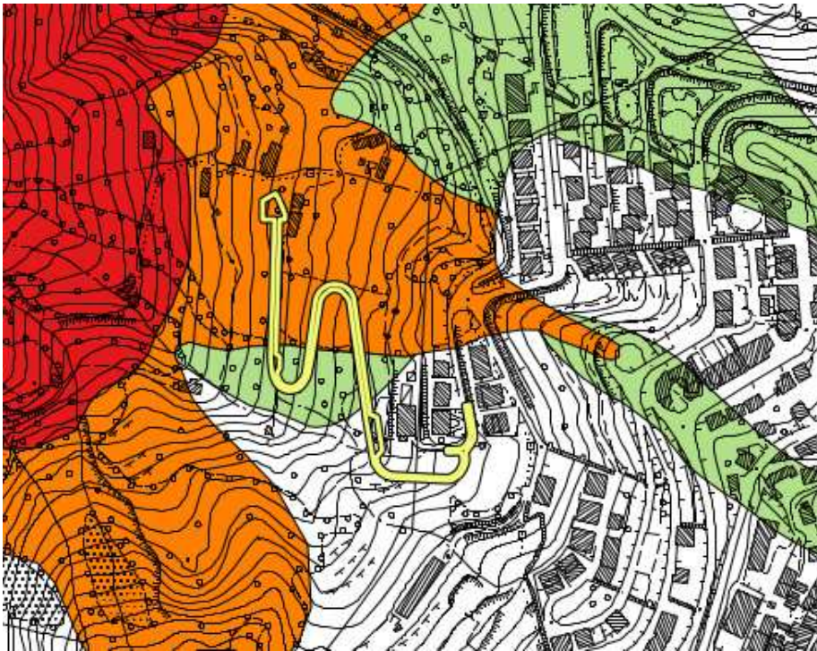
Pericolosità geologica del PAI del fiume Piave - 2016